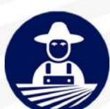
INGENIERÍA EN AGRONOMÍA