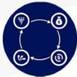
LICENCIATURA EN ADMINISTRACIÓN