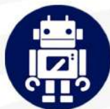
INGENIERÍA EN SISTEMAS COMPUTACIONALES