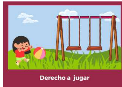
Derecho a jugar