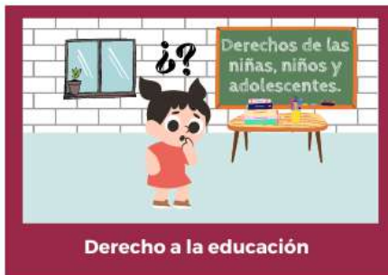
Derecho a la educación