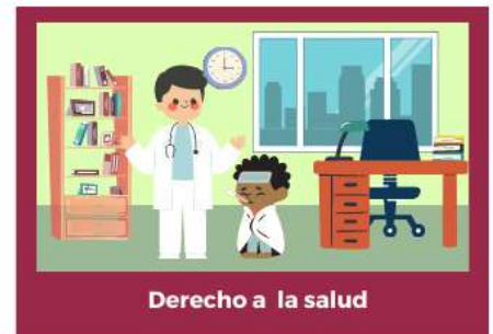
Derecho a la salud