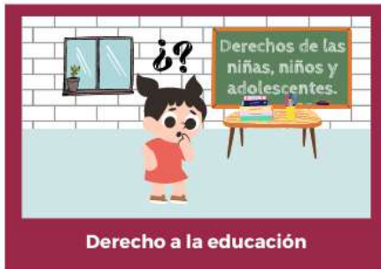
Derecho a la educación