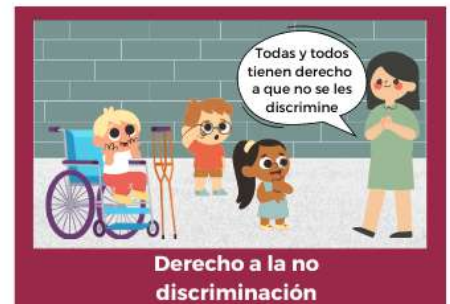
Derecho a la no discriminación