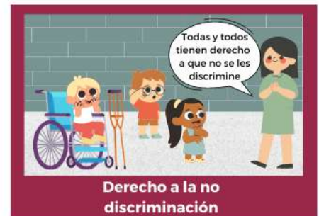
Derecho a la no discriminación