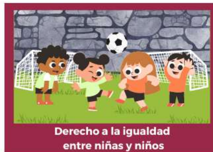
Derecho a la igualdad entre niñas y niños