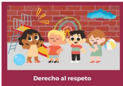
Derecho al respeto