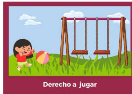
Derecho a jugar