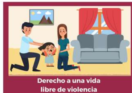
Derecho a una vida libre de violencia