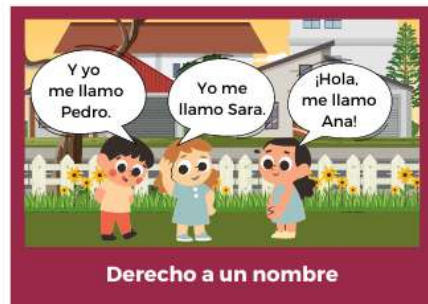
Derecho a un nombre