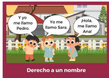
Derecho a un nombre